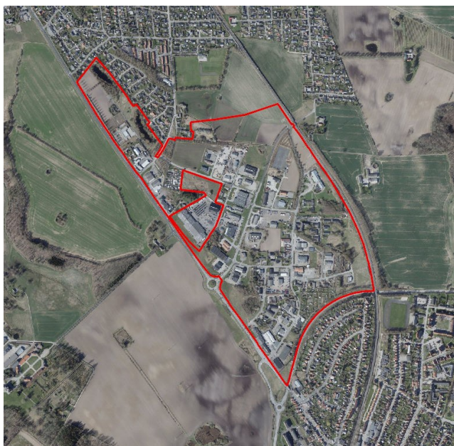
Placering af området